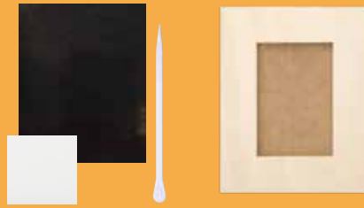
メタルフレームセット(黒)