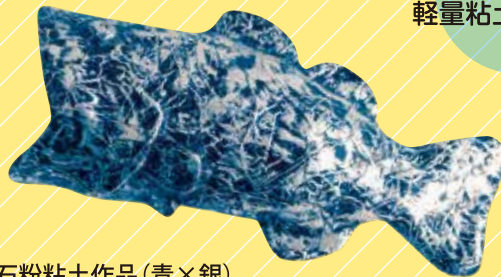
石粉粘土作品(青×銀)