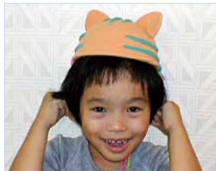
ネコのぼうし (スーパーカルモ-S・ミニ3色セット 各1個)