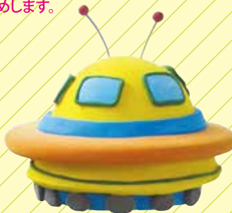
謎の円盤 スーパーカルモ-S